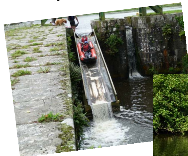
Ci-dessus : Glissière à canoë

. le Centre d'Entraînement Labellisé du Morbihan à Pontivy pépinière de champions et anti-chambre du Pôle France (nombreux jeunes envoyés en Equipe de France junior).