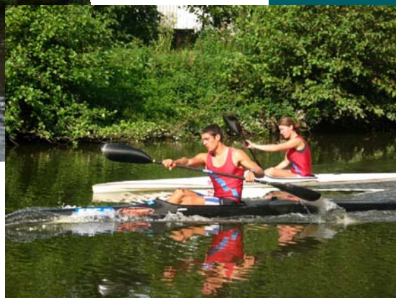
Ci-contre : S. Troel et V. Lecrubier