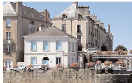
Maison éclusière de la Grandière avant restauration

De plus, le public pourra venir y chercher des renseignements sur la navigation ou les horaires d'écluses.